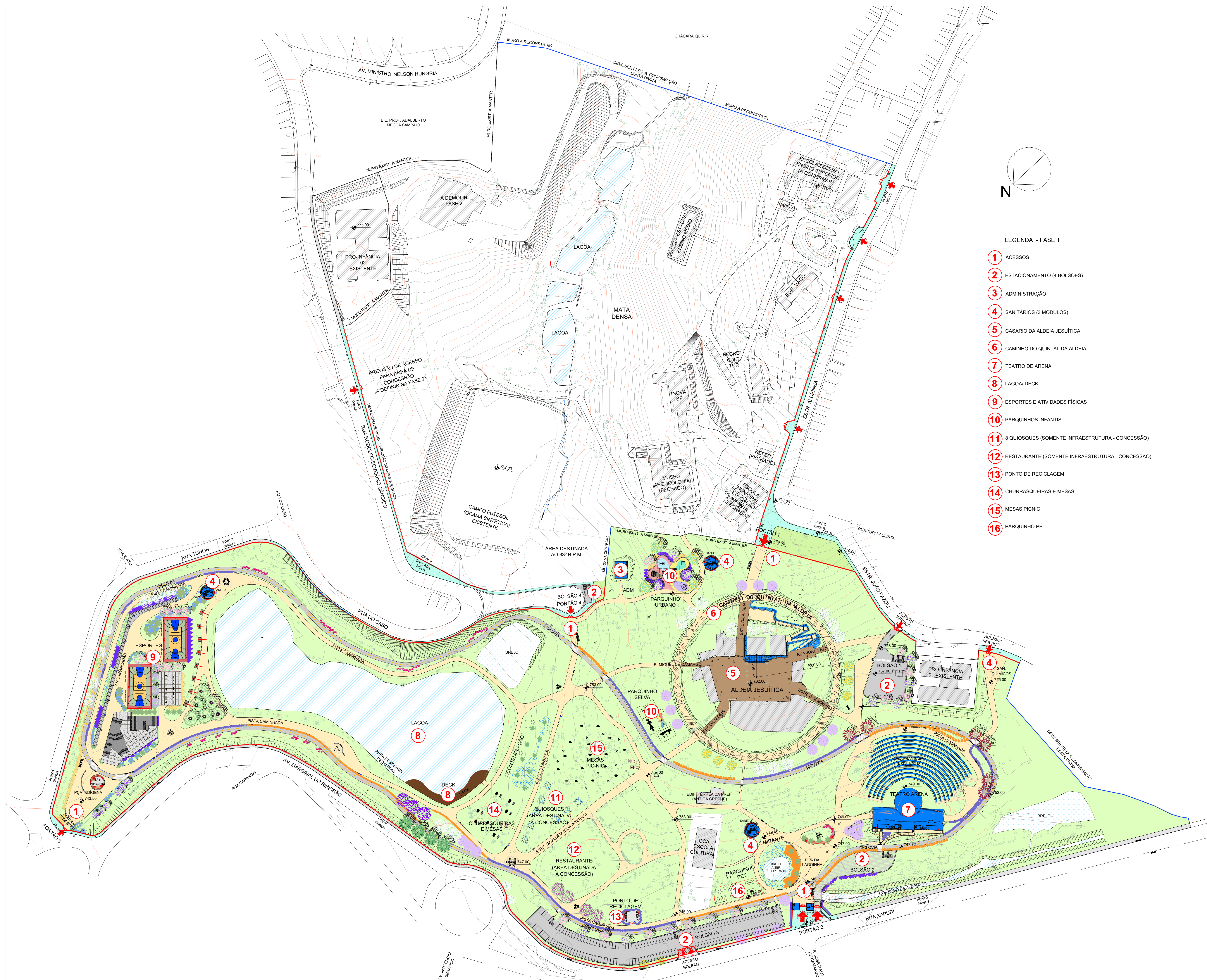
PARQUE DA ALDEIA DE CARAPICUÍBA - IMPLANTAÇÃO GERAL escala 1 : 1.000